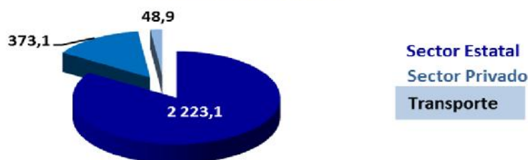
15.16 Gráfico: Estructura de los Ingresos asociados al Turismo Internacional en el año 2019