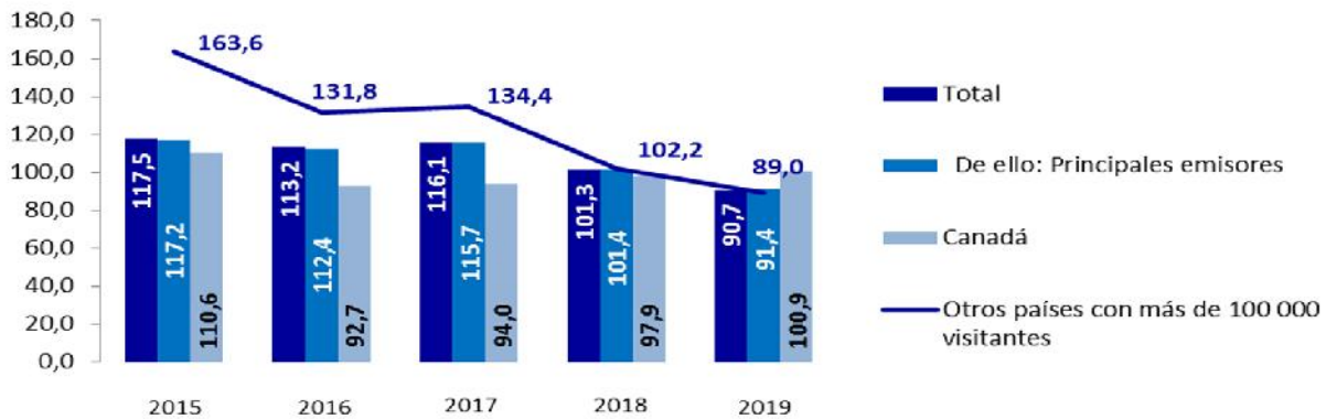
15.6 Dinámica en el comportamiento de los visitantes internacionales en los últimos cinco años